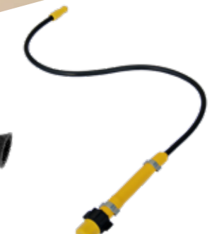
Mini-Flex: De flexibele verlenging voor verstuiven en sproeien