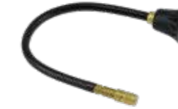
Buigbare verlengslang 26 cm voor Super Star 1.25