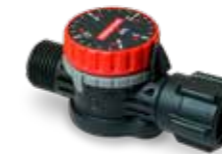
Instelbaar drukregelventiel PR 3