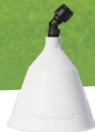
Capot de protection rond No.d'art. 11864801