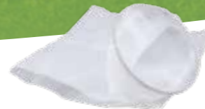
Sac filtrant bio No.d'art. 11475701