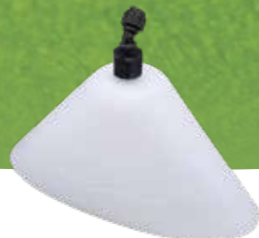
Capot de protection ovale No.d'art. 11871101