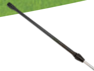
Lance télescopique 0.45 - 0.9 m No.d'art. 11659001-SB