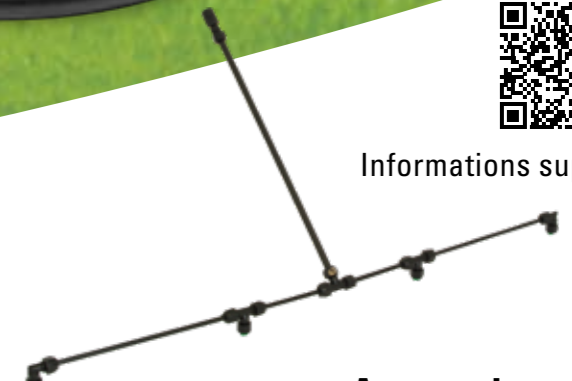
Rampe de pulvérisation en plastique No.d'art. 11659801-SB