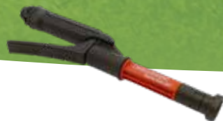
Vario Gun No.d'art. 11558501